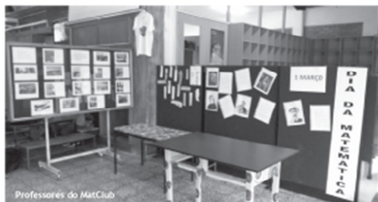
Professores do MatClub