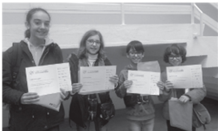
Professores de Matemática, Português, Inglês e Ciências Naturais

Esta é uma iniciativa da responsabilidade da Porto Editora, dirigida aos alunos dos 2.º e 3.º ciclos do Ensino Básico e consiste num desafio nacional e faseado, com o objetivo de promover a literacia e respetiva avaliação em quatro dimensões fundamentais do conhecimento: Leitura, Matemática, Ciências e Inglês.