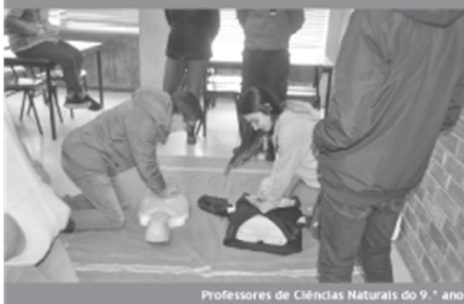
Professores de Ciências Naturais do 9.º ano

Os professores de Ciências Naturais vêm, deste modo, agradecer aos Bombeiros Voluntários de Cantanhede a forma como acolheram a proposta e se disponibilizaram para a dinamizar.